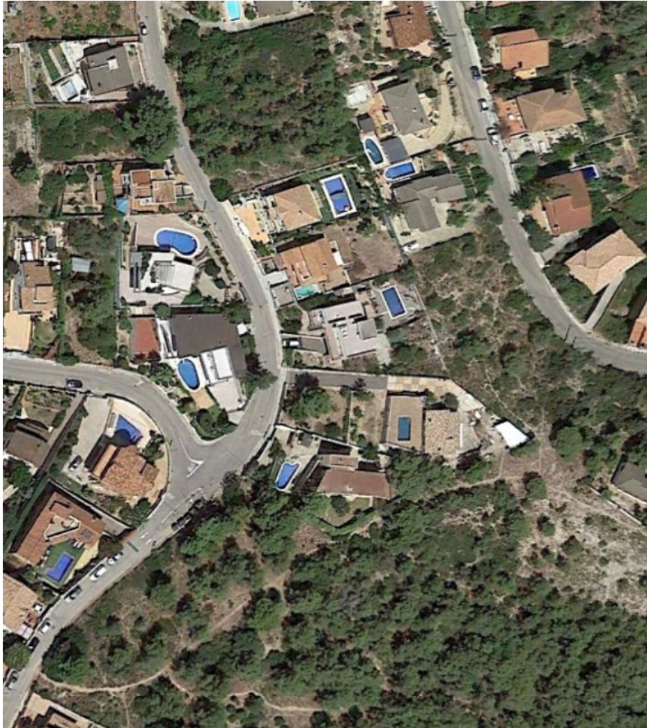
Ortofomapa Àmbit de la connexio prevista inicialment