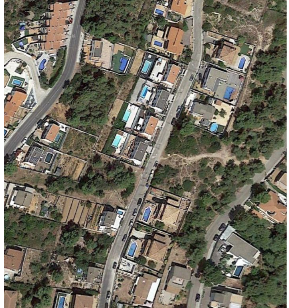
Àmbit de la connexió proposada