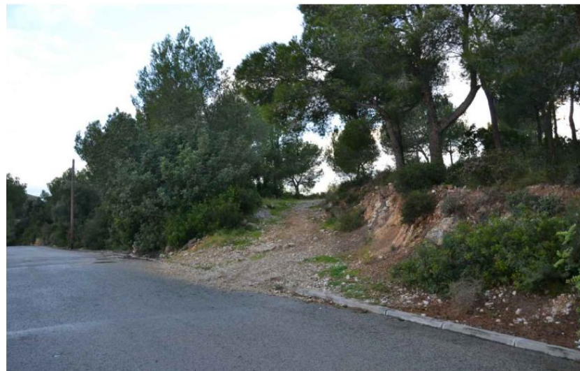
Accés existent a la zona verda