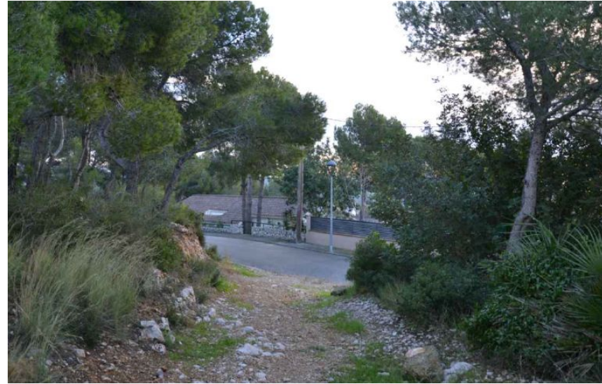
Vista del carrer Crisantem des de Calafell