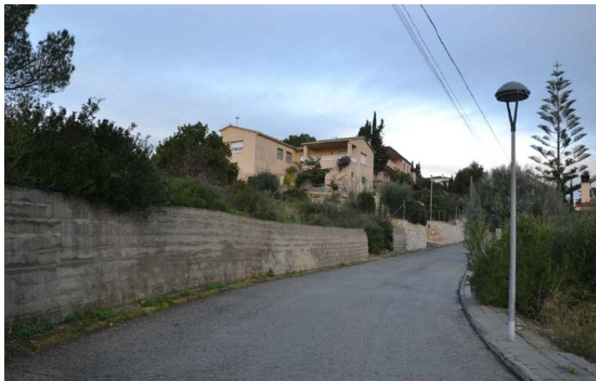
Carrer Crisantem, Cunit