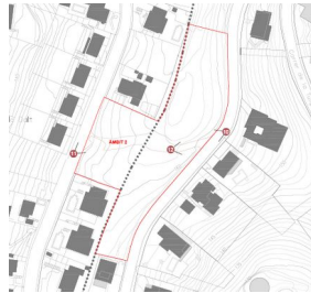
Imatges diferents situacions