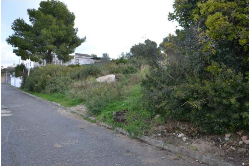
Avinguda Santa Maria ed Montserrat, Calafell